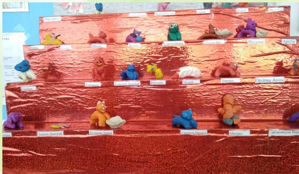
«Собачка со щенком»