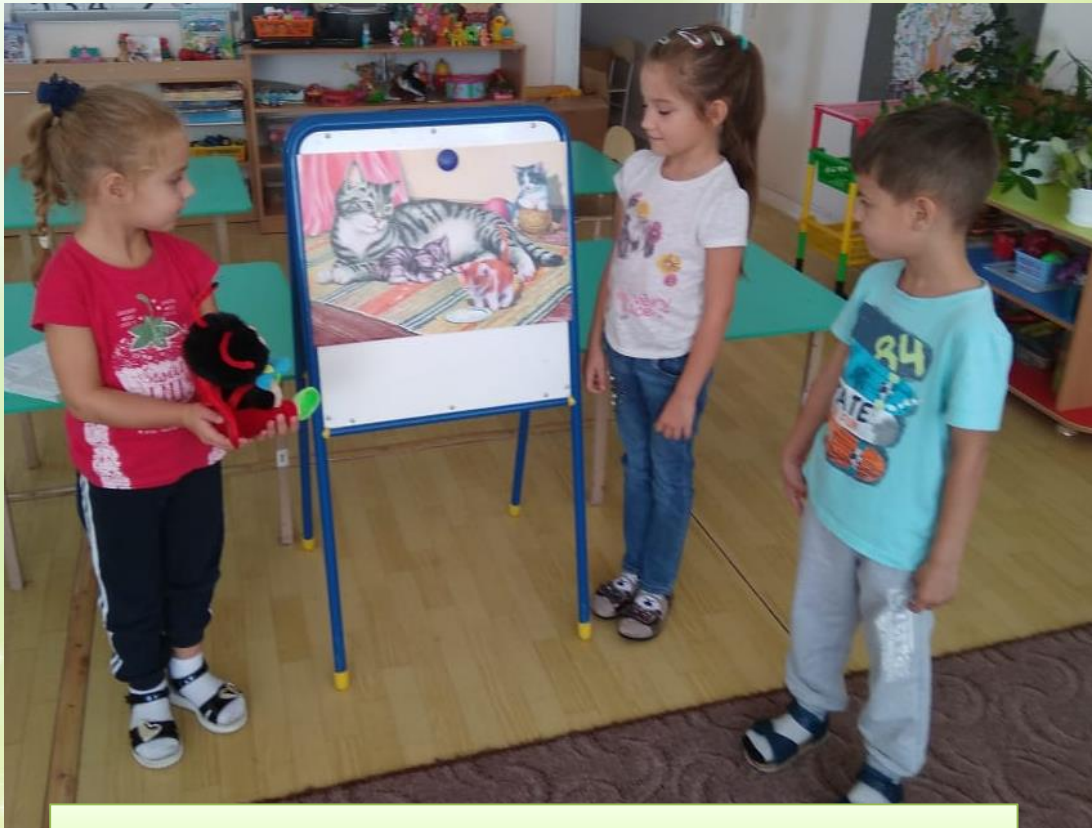
Составление сюжетного рассказа по картине